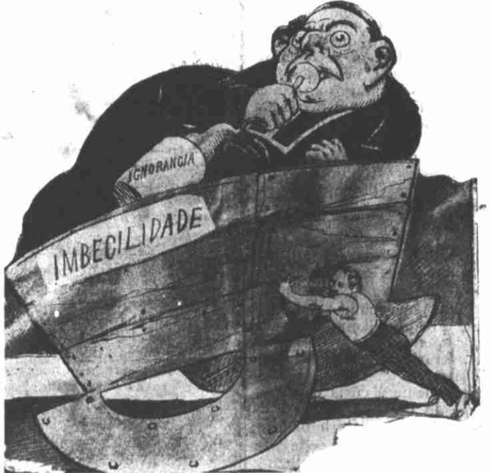
Embalado pelo povo inconsciente, vive o grande parasita estridado sobre a imbecilidade dos pobres de espirito e alimentando-se da ignorancia dos ingenuos que dão credito ás suas intrujices.